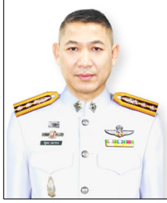
พ.ต.อ.รัฐพล เหลลาพรม ผกก.สภ.สีชมพู